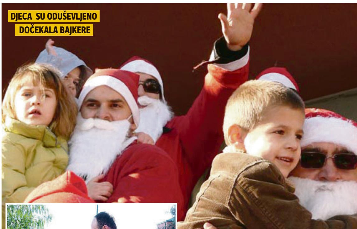
DJECA SU ODUŠEVLJENO DOČEKALA BAJKERE

Riječ je o hvalje vrijednoj i jedinstvenoj humanitarnoj akciji „Moto Mraz“ koju već četvrtu godinu zaredom organizuje motociklistička zajednica Crne Gore „No limit bykers“ koja uvijek pred Novu godinu, šticienicima Doma, osim sjajnog raspo-