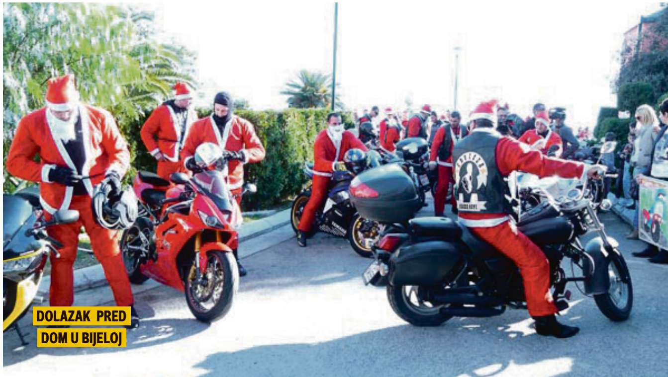
DOLAZAK PRED DOM U BIJELOJ

VIDEO-NADZOR NA GROBLJU Na lozničkom groblju postavljen je video-nadzor. Sa 12 kamera groblje će biti nadzirano 24 sata sa dva mjesta, iz prostorije na groblju i iz upravne zgrade KJP „Naš dom“. Groblje će dodatno biti osvijetljeno sa nekoliko većih reflektora.