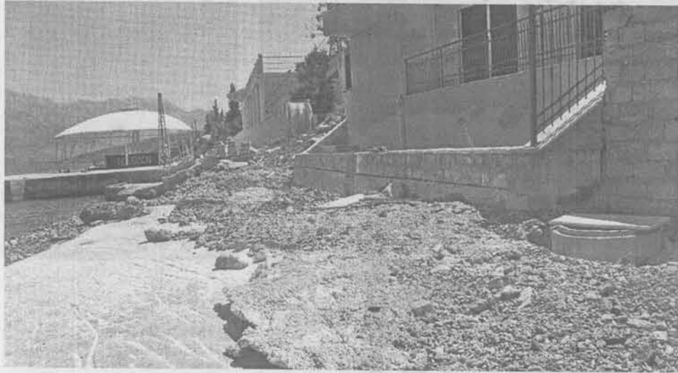
Спорни објекти изграђени на плажи у Крашићима

Управни суд је Министарству финансија и Управи за некретности наложио покретање новог поступка у коме, како је наглашено, морају донијети законито рјешење