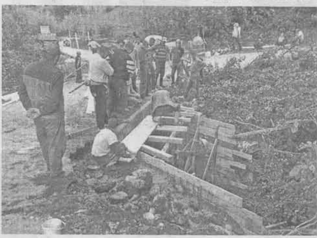
Радови у Трпезима