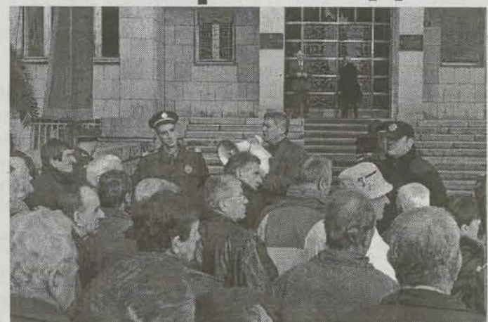
Са једног од протеста испред Скупштине

Радници и повјериоци подгоричке фабрике „Радоје Дакић“ протестоваће у понедељак испред Скупштине када буде бирана нова влада, како би све три гране власти подјелили на њихове проблеме.