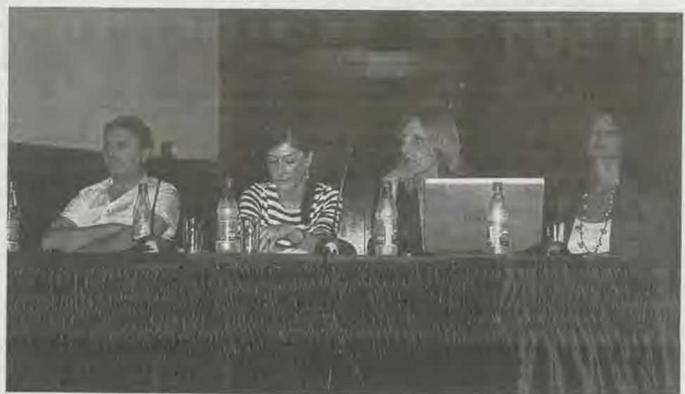
Учесници округлог стола

– Требало би да је пројекат ослоњен на главни пројекат,